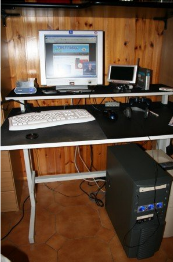
Postazione: foto n°2